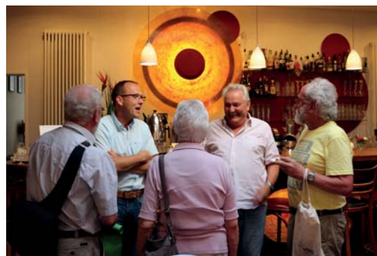
Nette Gespräche am Ende der Veranstaltung

„Ressourcenschonung und respektvoller Umgang mit der Umwelt“ geprüft. Stellvertretend nannte er die umfangreichen energetischen Sanierungen sowie die Begrünung von Flachdächern und das Anlegen von Blumenwiesen. Abschließend erwähnte er noch die Teilnahme des gesamten VWG-Teams beim walk4help im Mai dieses Jahres. Hierbei handelte es sich um eine Spenden-