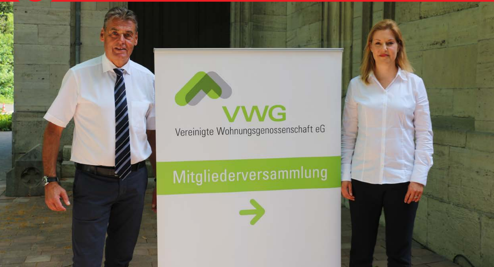
Hier geht's lang: Hinweissbanner zur Mitgliederversammlung