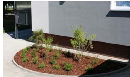
Ein neu angelegtes Pflanzenbeet

Des Weiteren wurden Pkw-Einstellplätze umstrukturiert und neu angelegt. Die ehemalige Garagenanlage wird ebenfalls noch in diesem Jahr durch eine neue Anlage ersetzt. Hier kam es im Vorfeld zu unerwarteten Verzögerungen, da die Baugenehmi-