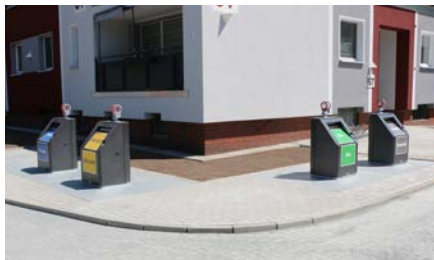
Das Unterflursystem zum Aufnehmen der unterschiedlichen Müllarten

Für die zukünftige Mülltrennung und Müllentsorgung wurde ein Unterflursystem installiert. Die unterirdische Anlage wurde Anfang April dieses Jahres in Betrieb genommen. Der Zugang zu den Mülleinwurf-schächten ist über ein Schließsystem geregelt, sodass eine unberechtigte Fremdbefüllung durch Dritte ausgeschlossen ist.